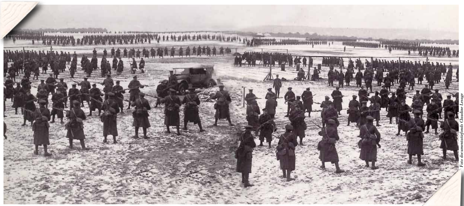
Het oefenveld van de Bull Ring, naast de huidige militaire begraafplaats, was het toneel van dagelijkse pesterijen en hoorn.